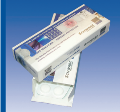
Rückverfolgbarkeit & Fälschungsschutz

Hinweis- und Sicherheitsschilder stellen eine wichtige Prävention von Arbeitsunfällen dar. Die korrekte und zuverlässige Anbringung der Schilder ist hierbei von besonderer Bedeutung. Neben der erhöhten Sicherheit wird zudem auch die Produktivität durch eindeutige und auffallende Hinweis-schilder gesteigert. Ob Standard-Verbrauchsmaterial wie Beschriftungs- und Farbbänder, leistungsfähige Etiketten- und Kennzeichnungsdrucker für stationären und mobilen Einsatz oder Kennzeichnungssoftware für die Schilder und Etikettenherstellung – in DYNAMIC Systems finden Sie einen zuverlässigen Lieferanten für alle Arten und Ausprägungen der Sicherheitskennzeichnung.