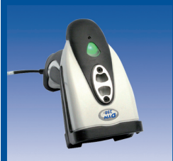
RFID, Lesegeräte & Datenerfassung