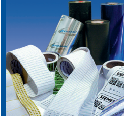
Etiketten & Kennzeichnung